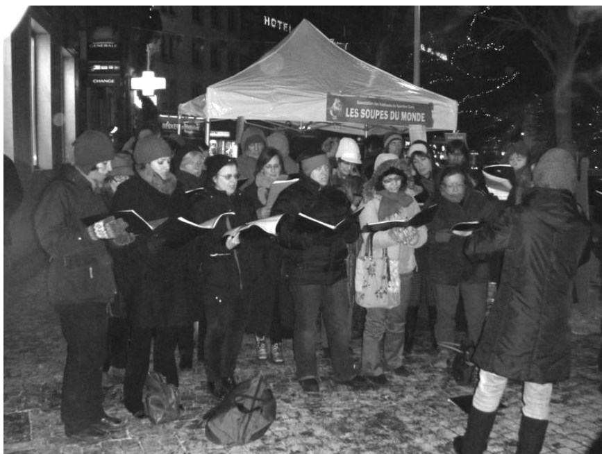
La courageuse chorale de « La Voix des Rails » à l'œuvre devant le stand de l'AHQG, lors des dernières Soupes du monde