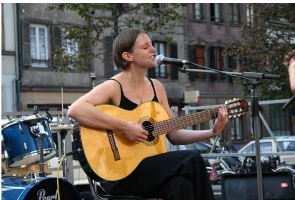
Magg © le transfo

http://mvdkwast.free.fr/stilglog/index.php/2005/09/05/mon-voisin-cet-artiste/