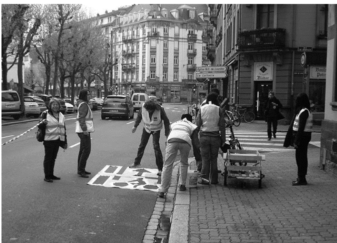
Les petites mains de l'AHQG à l'oeuvre au matin du... 1 er mai, pour réclamer une piste cyclable rendant possibles les relations nord-sud à vélo dans le quartier.

La dernière réunion de la commission « aménagement des boulevards » du Conseil de quartier), à laquelle participe notre association, a fait apparaître la demande d'une piste cyclable continue du quai Pasteur à la gare, sans que ne soient nécessaires pour cela des travaux de grande envergure, dans la mesure où ceux-ci se feront forcément lors de la mise en place de la ligne de tram allant vers Koenigshoffen, dans quelques années.