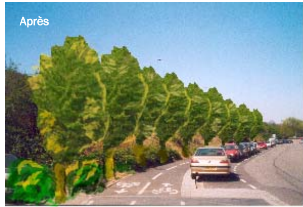
Rue du Ban de la Roche : Le talus autoroutier, terrain vague abandonné, pourrait avec quelques travaux d'entretien et de plantation devenir un cheminement vert de qualité