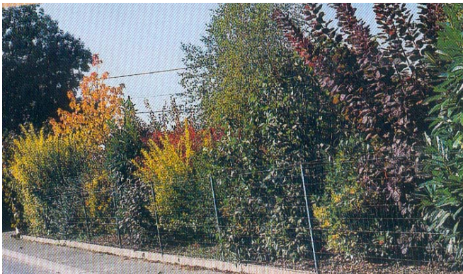
Un panaché d'arbustes ou de rosiers grimpants pour habiller avec élégance une clôture